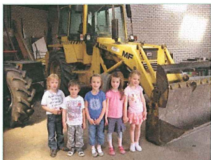
Plattelandsmuseum groep 1/2