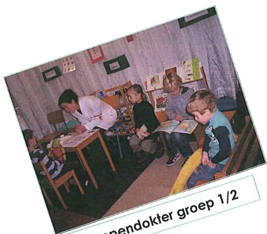
Poppendokter groep 1/2