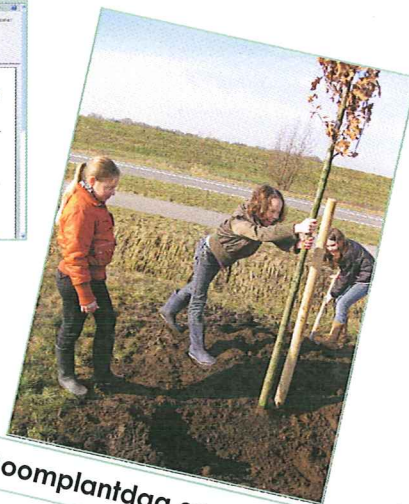
Boomplantdag groep 7