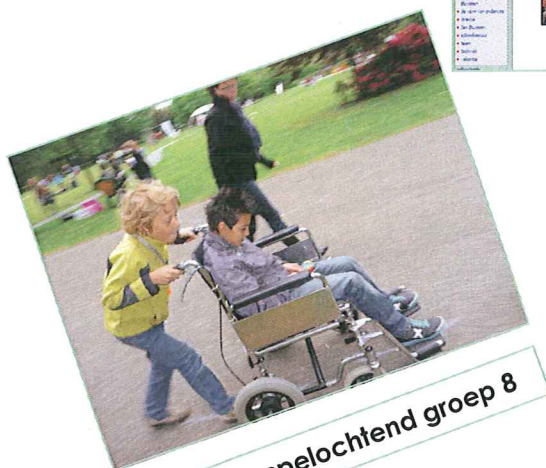
Ehbo spelochtend groep 8