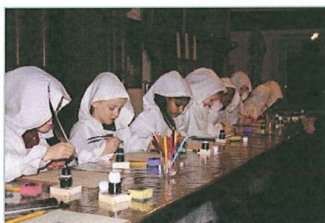
Museumbezoek groep 3