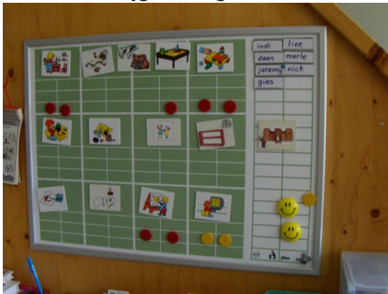
Takenbord in groep 1 – 2

De leerlingen die vanaf de peuterspeelzaal op school komen, leren van begin af aan spelenderwijs basisvaardigheden die nodig zijn voor hun verdere ontwikkeling. Het is niet zo dat de ontwikkeling van een kind geheel vanzelf verloopt. Een kind leert in de loop der tijd hoe het om moet gaan met culturele en sociale aspecten van onze maatschappij. Daarbij hebben de volwassenen een belangrijke rol. Zij vormen de verbinding tussen het kind en de cultuur. Het onderwijs in groep 1 - 2 legt een basis voor de vaardigheden die nodig zijn om verder te ontwikkelen. Daarbij is het niet zo, dat kinderen alles door de leerkracht krijgen aangereikt. Kinderen leren ook heel goed en heel veel van elkaar.