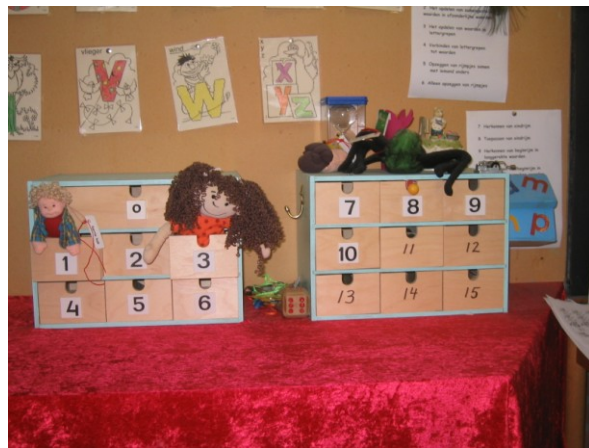
Klankkast in groep 1-2

Taal houdt in: praten met elkaar en luisteren naar de ander. De kringgesprekken vormen daar een belangrijk onderdeel van. Aanvullend vinden er diverse gerichte taalactiviteiten plaats, zoals taalactivering (rijmen, woorden klappen, nazeggen, etc.), dramaoefeningen en luisteropdrachten.