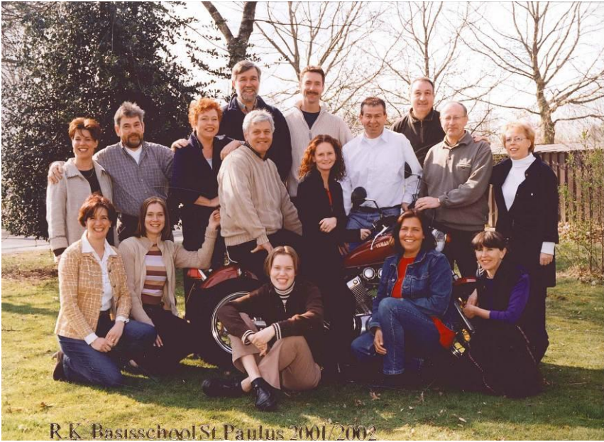
R.K. Basisschool St. Paulus 2001/2002